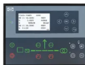
DEIF AGC 150

Контролер AMF з розширеними можливостями моніторингу та комунікації, підходить для проектів, де потрібна розширена функціональність та ширші можливості інтеграції.