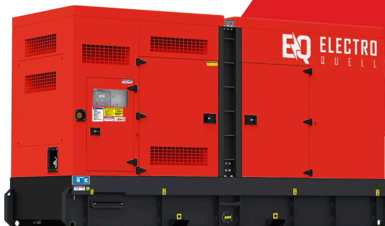
Image illustrative. Les détails réels du produit peuvent différer de l'illustration.