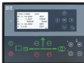
DEIF AGC 150

AMF krmilnik z razširjenimi možnostmi spremljanja in komunikacije, primeren tam, kjer so potrebne napredne funkcionalnosti in širše možnosti integracije.