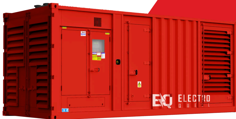
Immagine illustrativa. I dettagli del prodotto reale possono differire dall'illustrazione.