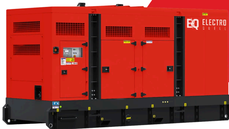
Image illustrative. Les détails réels du produit peuvent différer de l'illustration.