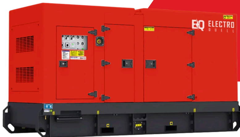
Image illustrative. Les détails réels du produit peuvent différer de l'illustration.