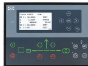
DEIF AGC 150

AMF-kontroller med utvidgad övervaknings- och kommunikationskapacitet, lämplig där avancerad funktionalitet och bredare integrationsalternativ krävs.