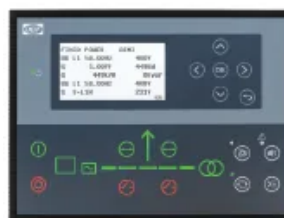
DEIF AGC 150

Контролер AMF з розширеними можливостями моніторингу та комунікації, підходить для проектів, де потрібна розширена функціональність та ширші можливості інтеграції.