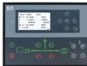
DEIF AGC 150

DEIF AGC 150 Alternativna opcija AMF kontrolera, obično odabrana kada je DEIF kontrolna platforma poželjna za projekat.