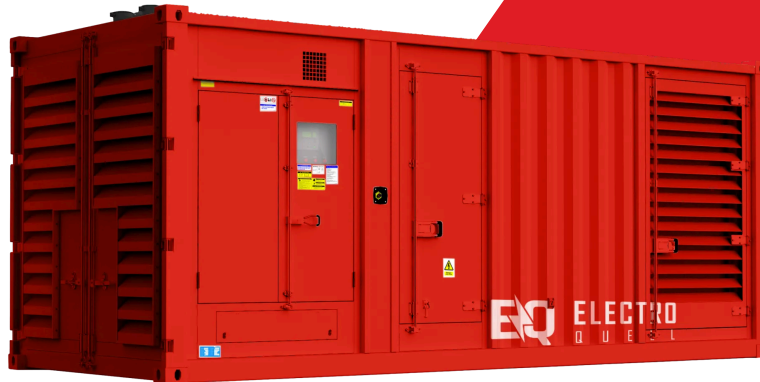
Image illustrative. Les détails réels du produit peuvent différer de l'illustration.