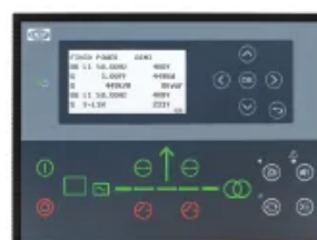
DEIF AGC 150

Контролер AMF з розширеними можливостями моніторингу та комунікації, підходить для проектів, де потрібна розширена функціональність та ширші можливості інтеграції.