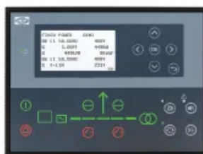
DEIF AGC 150

DEIF AGC 150 Альтернативний варіант контролера AMF, зазвичай обирається, коли для проекту віддається перевага платформі управління на основі DEIF.