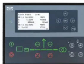
DEIF AGC 150

Controlador AMF con capacidad de monitoreo y comunicación ampliada, adecuado donde se requieren funcionalidades avanzadas y opciones de integración más amplias.